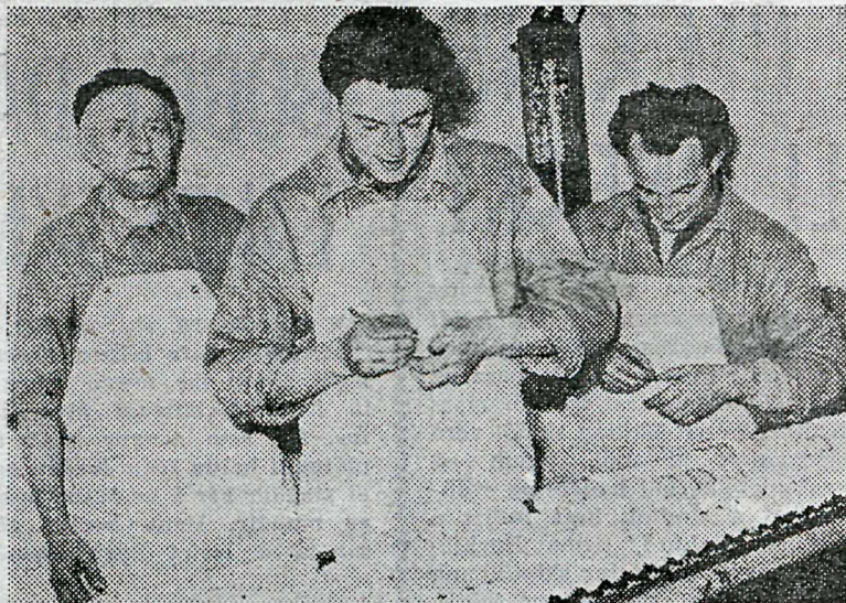
Piet og tveir af vinnufélögum hans. Fleiri hafa skrifað nöfn sín á eggin síðan hann gerði það.

— Þetta er allt saman hræðilegur misskilningur. Ég hef í hyggju að taka á leigu íbúð í hverfinu og vildi bara fullvissa mig um, að ekki byggj annað en skikkantlegt og siðprútt fólk í nágrenninu.