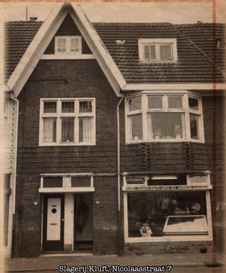
Slagerij Kluft, Nicolaasstraat 7

Omstreeks 19:00 uur diezelfde dag nog wordt het lichaam