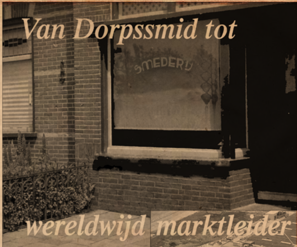
Foto boven: De smederij in 1959, Noordeinde 72, Oostzaan Uit het boek: Vervlogen Tijden, 2010 Foto rechts: Collectie Meyn

Westeinde 6, 1511 MA Oostzaan Postbus 16, 1510 AA Oostzaan T: +31 (0) 20 2045 000 F: +31 (0) 20 2045 001 l: www.meyn.com