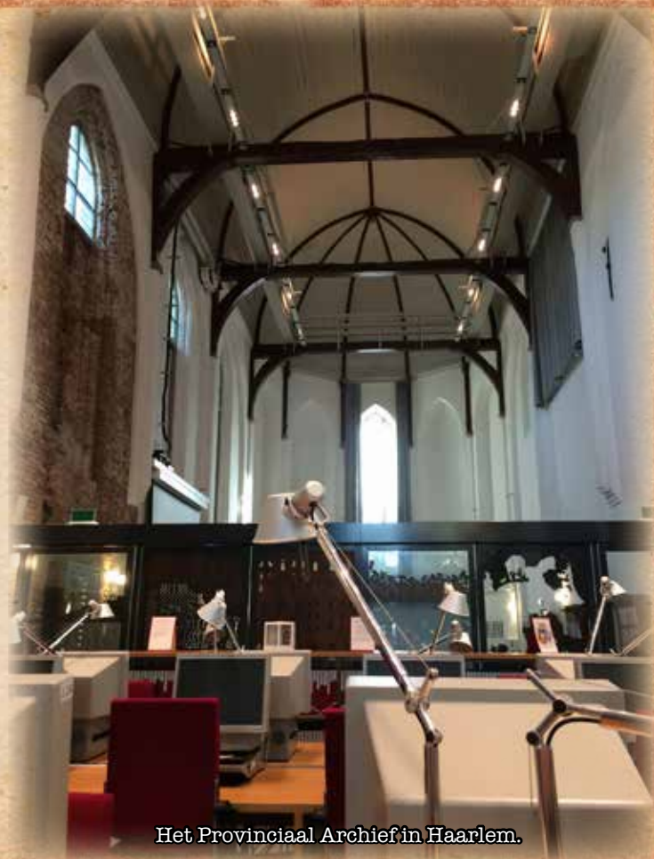
Het Provinciaal Archief in Haarlem.