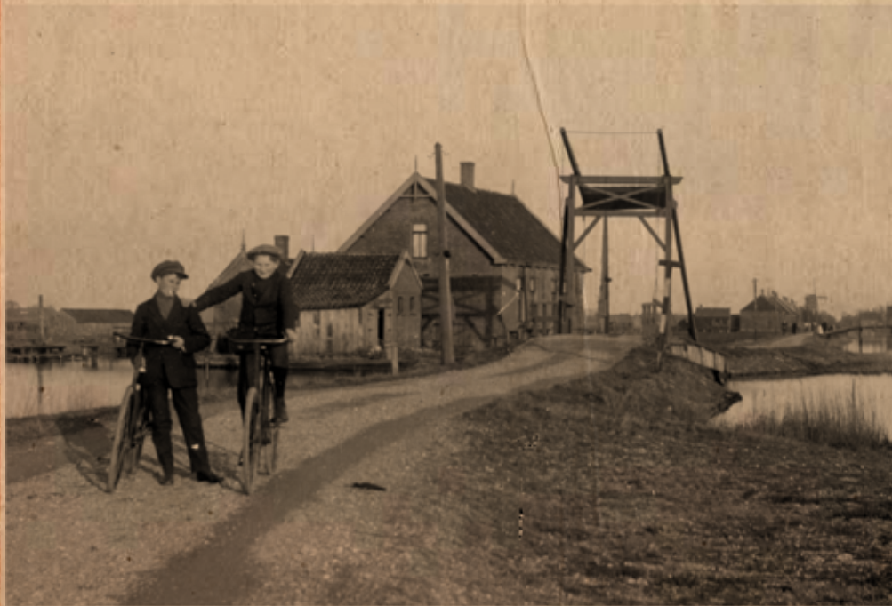
Het Weerpad (nu Kerkstraat) in 1916 met de Wateringbrug

Al in 1916 kochten Oostzaners bij de firma Dral hun vracht-, bak- of gewone fiets. Want Dral is al sinds 1907 niet zomaar een fietsenmaker, maar "DE FIETSENMAKER" van Oostzaan.