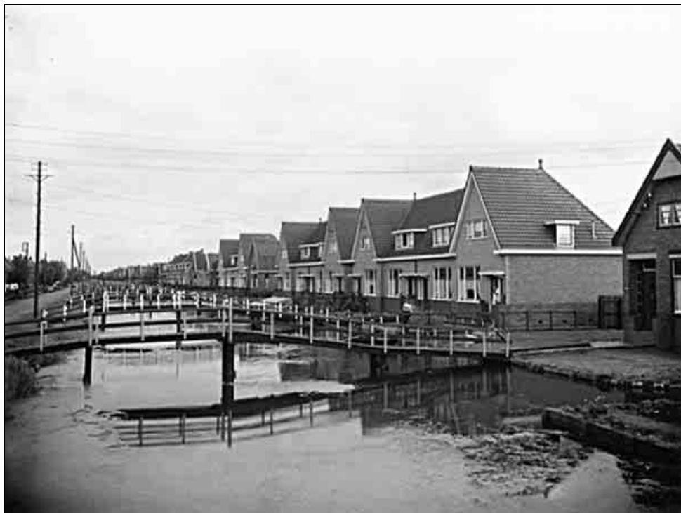
De Kerkstraat in Oostzaan.

re. Die werden gevoerd met oud brood, met een paar bussen kippendarmen, die dan eerst gekookt werden op de vuurduvel, een klein breed kacheltje. En daar groeiden die beesten geweldig van. En daar werd nog wel behoorlijk op verdiend, heel wat beter dan op die ‘achteruitkrabbers’ zoals mijn moeder de kippen noemde. Als de varkens waren verkocht, dan kregen haar dochter en schoondochter nog wel het een en ander toegestopt, of zij bezochten gezamenlijk diverse winkels. Ik was 21 jaar toen ik uit mijn werk naar een winkel ging voor een motorfiets. Daar had ik