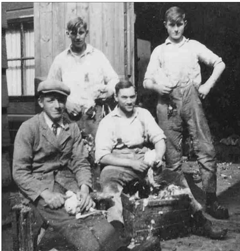
Kippenplukkers aan het werk.