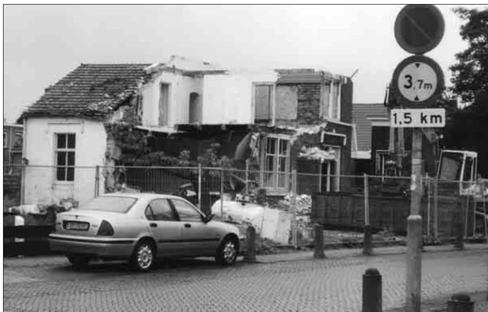
De sloop van het postkantoor in september 2002

ker in de Kerkbuurt en woonde in 1900 op B 11. Hij was gehuwd met Aagtje van der Hulst, geboren op 10-12-1849. Bij hem woonde een onderwijzer en een postbode in.