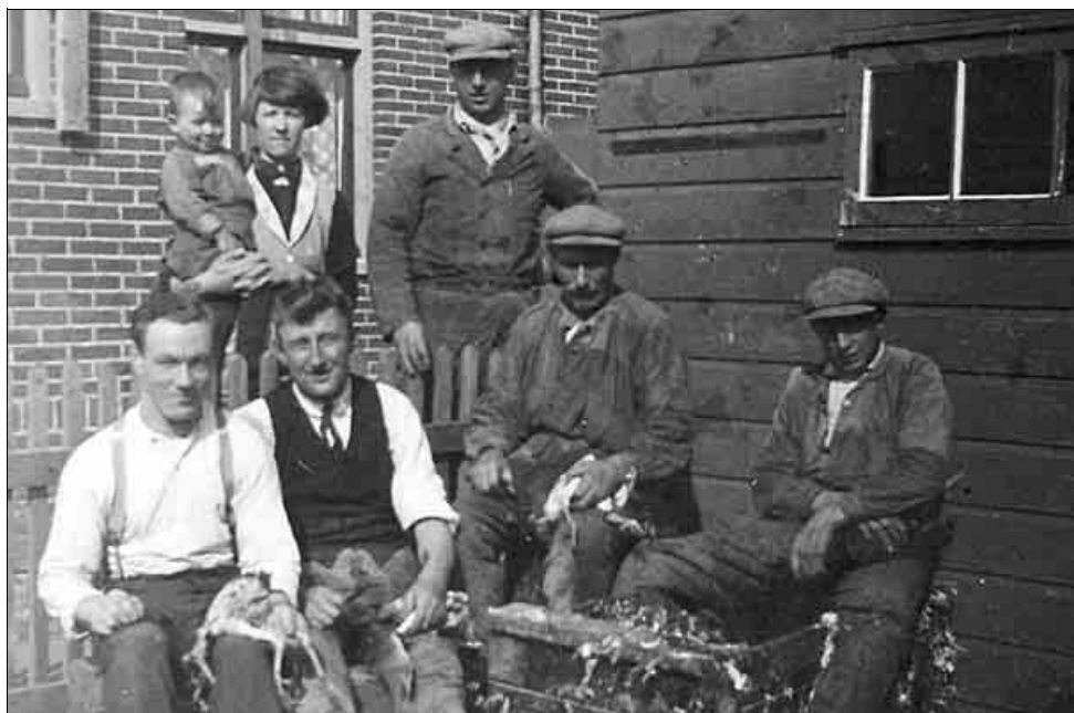
Kippenplukkers aan het werk.