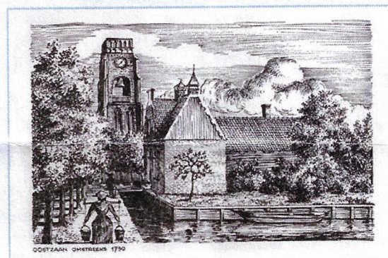
Oostzaan rond 1750